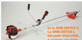
Ici la SRM-300TES U. La SRM-300TES L est aussi disponible, à poignée circulaire.