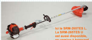
Ici la SRM-265TES L. La SRM-265TES U est aussi disponible, en version à brancard.

Plus de couple pour des travaux plus durs et un usage plus intensif