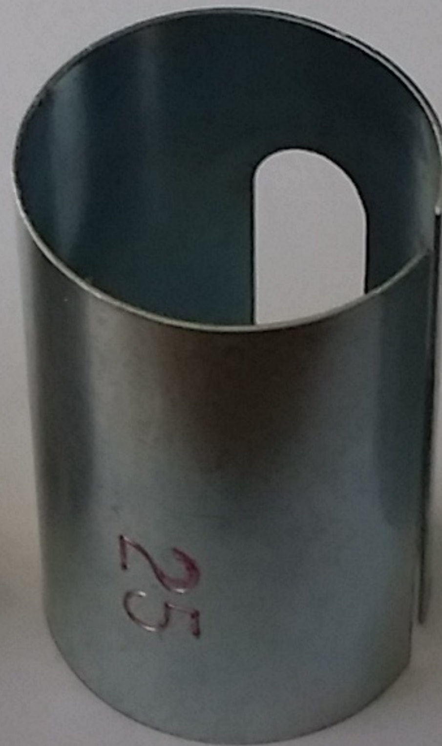
pour tube de diamètre 25 mm