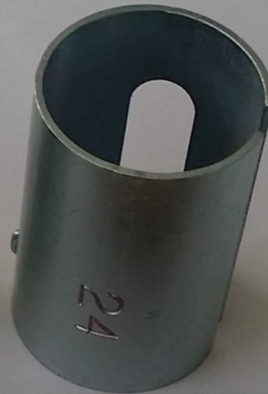
pour tube de diamètre 24 mm